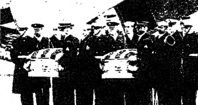
النحنان ملوفان يلعن الأميركيين في المنظار قلمه بوش